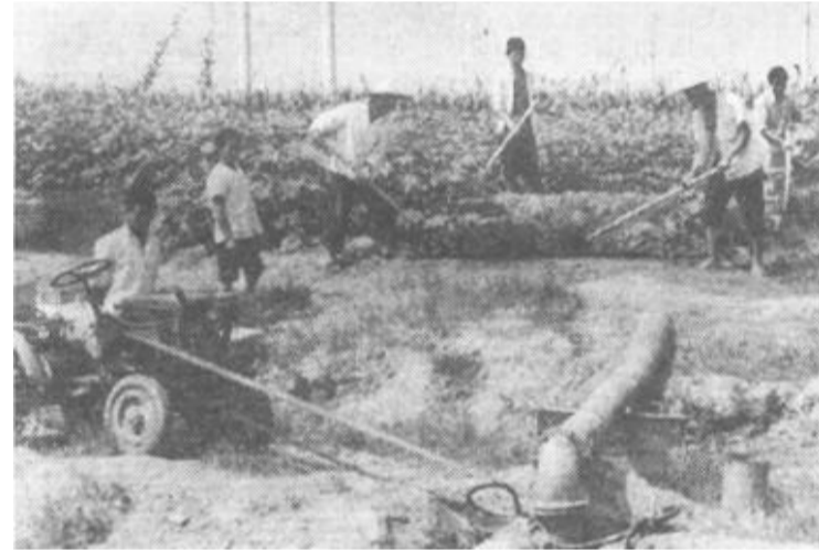
垦利县郝家乡抗旱保秋保种抓得早、行动快，到8月28日，全乡34000亩农作物已普浇二遍水。

(一)千方百计组织收入，狠抓入库。财政、税务、金融等有关部门要积极配合，搞好整顿个体税收秩序和清理拖欠税款的工作。特别对于实行承包的企业，要严格按政策规定办事，给企业留一点后劲，以培植更多的梯级财源。(二)下决心节减和控制支出，采取坚决措施，切实把支出管紧、管严、管细、管好。其中要把压缩支出的重点放在压缩公用费用、停止计划外基建项目、反对